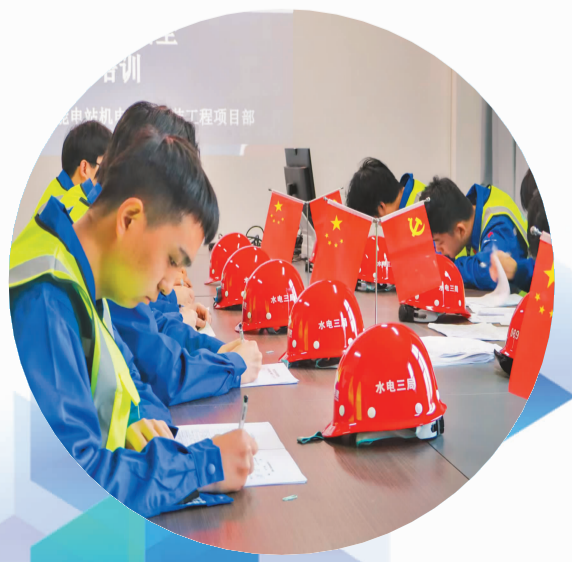
新入场人员开展安全教育

项目党支部积极与业主方开展党组织联建共建，开展植树、廉政教育、知识竞赛等活动，并组织高考志愿服务、助农帮扶、金秋助学等社会公益活动，以实际行动彰显央企责任担当。构建“四季送”关怀职工体系，组织党员、团员开展“高考爱心服务队”，志愿服务、助农采购农产品、健康体检、夏送清凉、金秋助学等活动，建立心理健康关怀机制，对8名职工进行一对一疏导，并通过文体比赛、国庆汇演等活动增强团队凝聚力。纪检工作聚焦主责主业，涵养风清气正干事氛围，签订责任书15份，召开专题会议4次，编制涵盖7个领域138个风险点的廉洁风险防控清单，常态化开展廉洁教育，紧盯关键节点，列席“三重一大”会议37次，开展专项检查6次，公示事项148项，保障项目权力规范运行，建设流程透明合规。