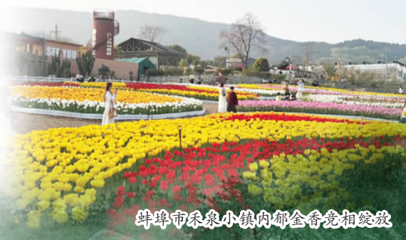
蚌埠市禾泉小镇内郁金香竞相绽放

从不泉小镇的烟火气与欢声笑语,到双墩遗址的厚重历史与文明回响,蚌埠市正以丰富多样的文旅业态,让游客在休闲中感受文化,在体验中读懂历史。春游江淮,不妨走进蚌埠,赴一场既有“看头”又有“玩头”的春日之约。