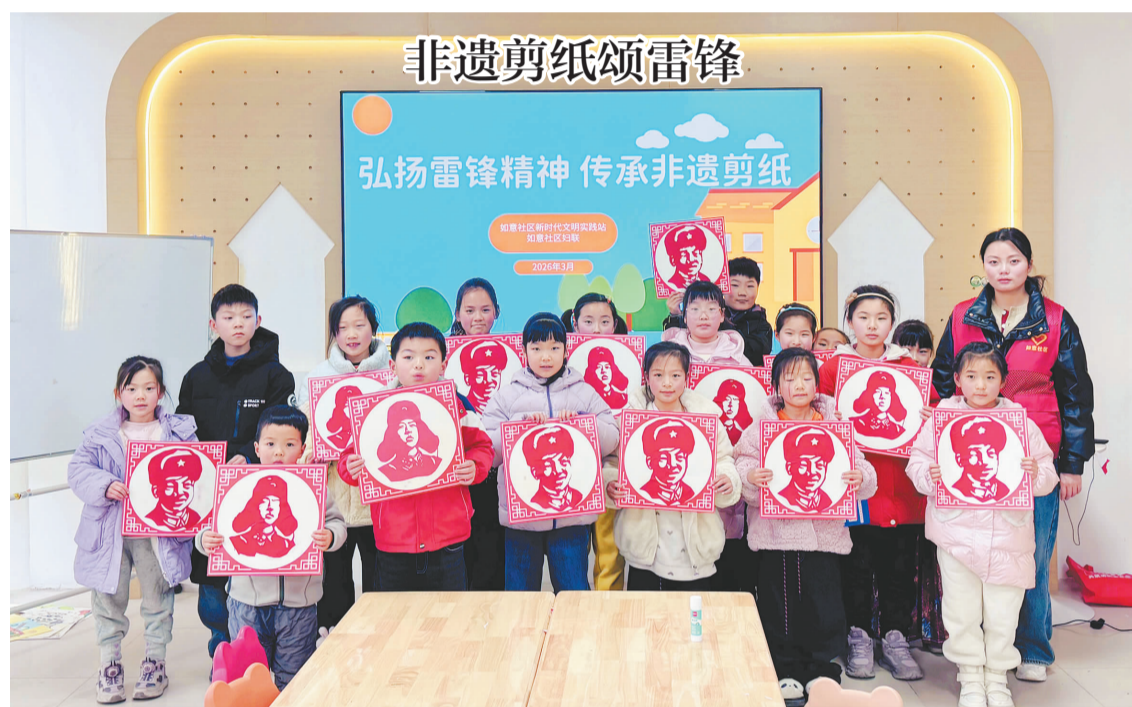
为进一步弘扬雷锋精神和中华优秀传统文化，近日，凤阳县中都街道如意社区新时代文明实践站开展“弘扬雷锋精神 传承非遗剪纸”主题活动。活动以寓教于乐的形式，在未成年人心中播下传承非遗与学习雷锋的种子。(潘如敏/文)

人勤春来早，实干正当时。兴宇汽车的生产状态是凤阳县经开区规上工业企业的缩影，各大工业企业元气满满，焕新出发。据统计，截至目前，凤阳县经开区规上工业企业基本全面复工，正以跃马扬鞭的勇气、万马奔腾的活力、马不停蹄的干劲，奋力冲刺首季“开门红”。(吴少渝 胡松)