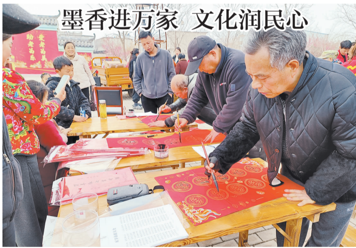
日前，凤阳县武店镇灵泉村组织书法爱好者开展了“笔墨丹青暖人心”志愿服务活动。书法爱好者挥毫泼墨，笔力苍劲，将美好的祝福与对美好生活的向往倾注于笔墨之间。

从人工到智能，从慢审到秒办，凤阳医保局以数字化改革回应民生关切，用技术创新赋能服务升级，为构建“互联网+医保”新格局贡献基层智慧。（林国玉）