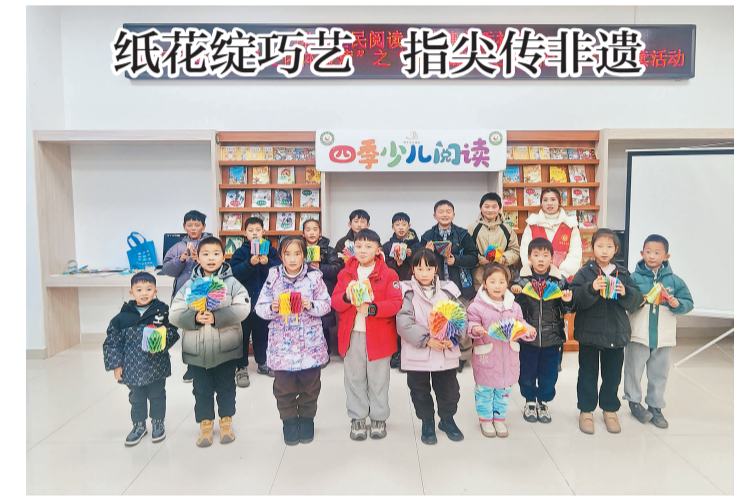
日前，凤阳县图书馆开展了“文化体验馆”之“指尖翻花 古韵新生”主题阅读活动。15名小读者欢聚一堂，沉浸式体验非遗魅力，传承中华优秀传统文化。本次活动引导青少年与传统非遗实现“零距离”接触，不仅帮助他们掌握翻花的基本制作技艺，在实践中感知民俗之美，更增强他们对中华优秀传统文化的认同与自信，为非遗的活态传承注入新鲜活力。

此次专场招聘会的成功举办，是凤阳县人力资源服务产业园优化公共就业服务的具体实践。据悉，园区将结合市场供需变化，常态化开展零工专场招聘活动，持续升级电子屏信息显示精度与岗位匹配效率，不断完善服务场景、拓宽服务覆盖面，让零工市场成为稳就业、保民生、促发展的坚实纽带。（许梦源 张文洲）