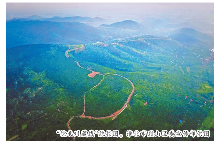
“皖北川藏线”航拍图。

作为长三角重要的先进制造业基地和综合性国家科学中心,合肥已形成“芯屏汽合”“集终生智”等标志性产业地标,集成电路、新型显示、人工智能、新能源汽车、光伏等产业集群竞争力持续提升。此次入选首批创建城市,将为合肥工业高质量发展注入新动能,助力安徽打造新型工业化先行区,为国家加快推进新型工业化贡献更大力量。(本报记者 汤明辉)