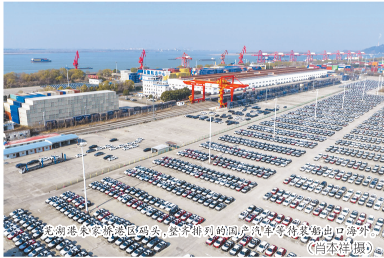
芜湖港朱家桥港区码头,整齐排列的国产汽车等待装船出口海外。

在合肥,供应商数量超过2000家,在动力电池、智能座舱、汽车电子及关键零部件等多个领域,已形成较为完善的产业链配套体系,代表性企业有国轩高科、科大讯飞等;同时,蔚来、比亚迪