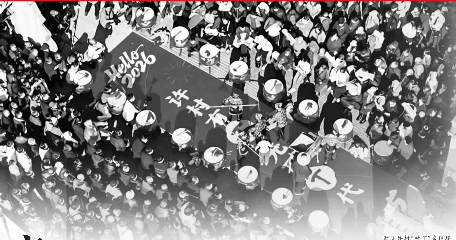
歙县许村“村T”秀现场

近日,歙县许村的古街之上,一场别开生面的“村T”秀火热上演。粉墙黛瓦的古建间,这场创新的T台展演跳出传统时装秀的框架,将歙县的传统农具、特色农产品、非遗技艺与新农人故事等一一搬上舞台,生动彰显出乡村文化的独特魅力。